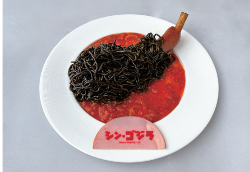
シン・ゴジラ ~漆黒の怪獣王のブラック焼きそば~ 1,600円