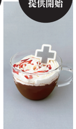
葛城ミサトの ホットショコラ 850円