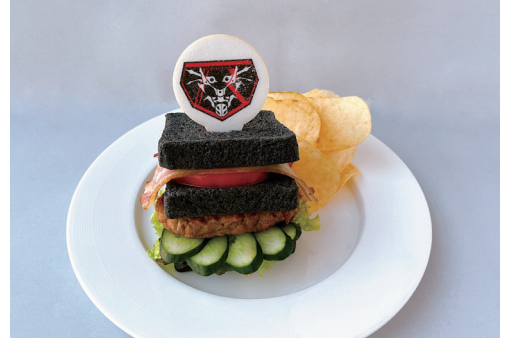
シン・仮面ライダー ~世界の平和を守る!“人類の幸せ”を挟む竹炭サンド~ 1,500円