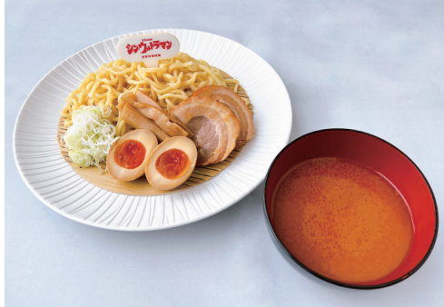
辛(シン)・ウルトラマン ~正義の赤い辛みそつけ麺~ 1,400円