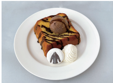
ガラブの フレンチトースト 1,100円